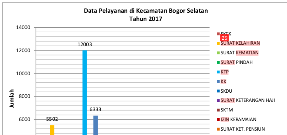
Gambar 1.5 Diagram Data Pelayanan Kepada Masyarakat di Kecamatan Bogor Selatan Tahun 2017

Pelayanan prima adalah suatu pelayanan yang diberikan kepada masyarakat oleh aparatur pemerintahan Kecamatan Bogor Selatan. Hasil yaitu terselesaikannya semua permohonan pelayanan dari masyarakat baik berupa legalistik perizinan maupun keterangan biasa sesuai dengan standar pelayanan yang berlaku. Berikut ini adalah data pelayanan yang diberikan oleh pemerintah Kecamatan Bogor Selatan kepada masyarakat pada tahun 2017: